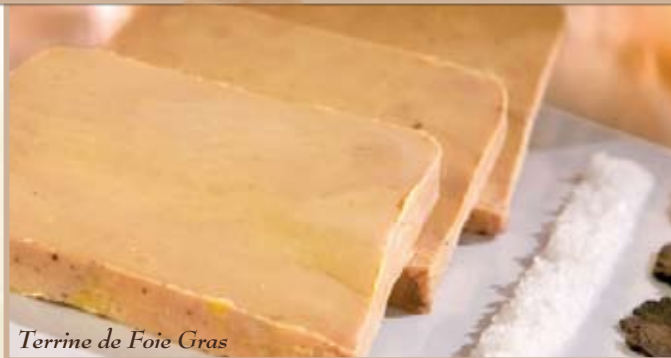
Terrine de Foie Gras