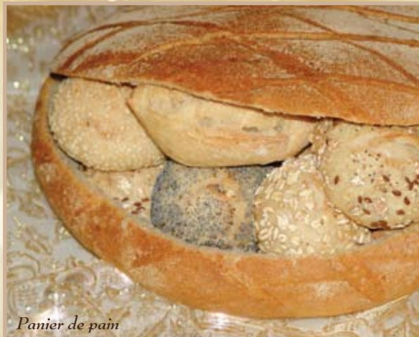
Panier de pain