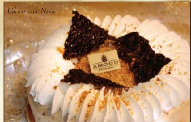
Glace aux Noix