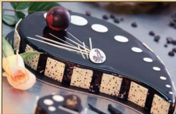
Larme de Tahiti