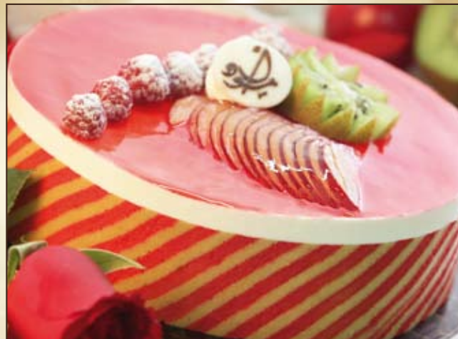
Passion de Fruits