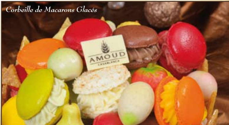
Corbeille de Macarons Glacés