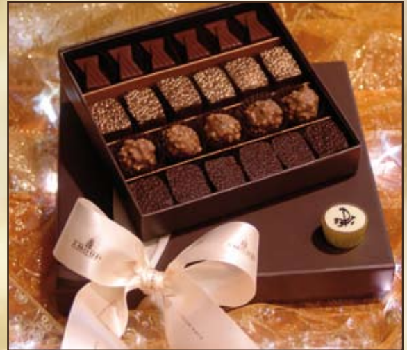
Ecrin de Chocolat