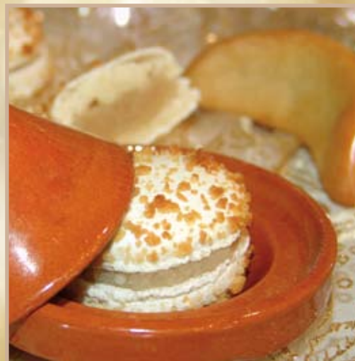
Macaron Corne de Gazelle