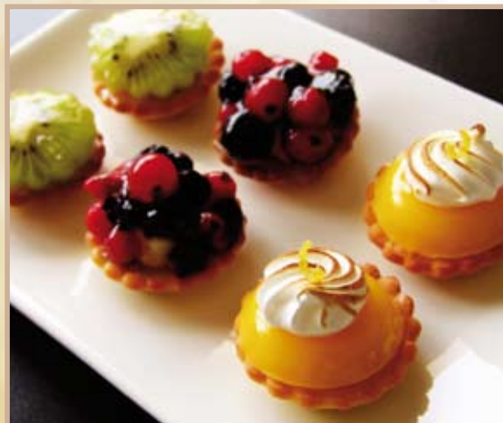
Gâteaux Soirée Prestige