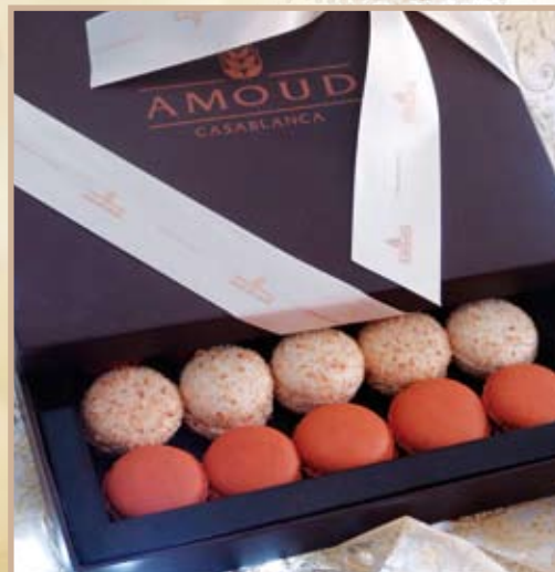
Ecrin de Macarons