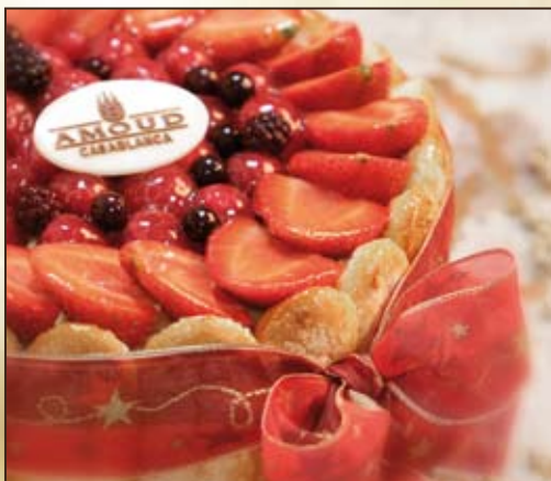
Charlotte aux Fruits