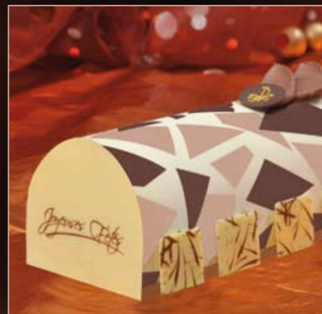
Larme de Tahiti