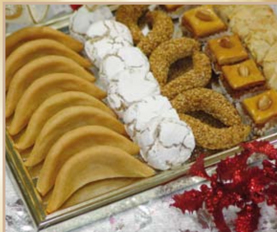
Petits Fours Beldi